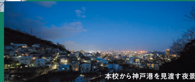
本校から神戸港を見渡す夜景

本校から専用バスで約30分の神戸市西区にある神戸第一高等学校西キャンパス。野球部、陸上部を中心とした野外競技の拠点として利用しています。