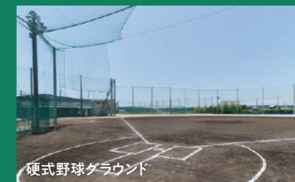
硬式野球グラウンド