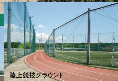
陸上競技グラウンド