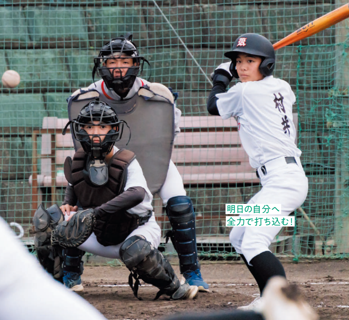
明日の自分へ 全力で打ち込む!